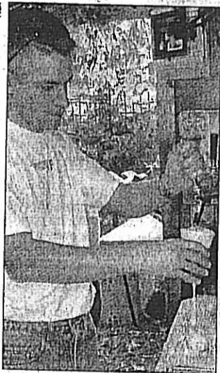
Petite brasserie, mais grands arômes...

Ces bières méconnues répondent au doux noms poétiques de « Fausse Blonde », « Dame Blanche », « Veuve Noire », « Baie des Anges » ou « Fleur du